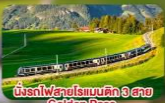
นั้งรถไฟสายโรเมนติก 3 สาย Golden Pass / Luzern Interlaken Express / Gornergrat