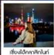
เชียงใหม่คลาสสิกไนท์