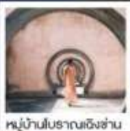
หมู่บ้านโบราณเชิงชาน