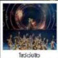
โชว์เวบชีง