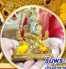
รับพระพิฆเนศวร ปางรำรอย ท่านละ 1 องค์