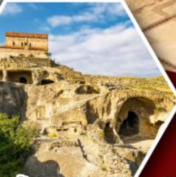
เมืองถ้ำอพลิสตซ์เคห์