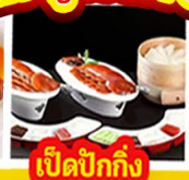
เปิดปิ้งกั๊ง