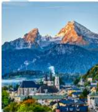
ออสเตรียบาวาเรียดินแดนแห่งเทพนิยาย