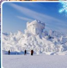
งานแกะสลัก เกาะพระอาทิตย์