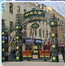
ถนนจงยาง