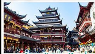
ตลาดร้อยปีเฉิงหวงเมี่ย