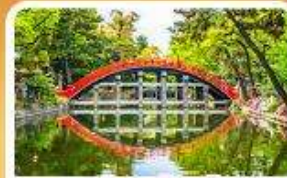
ศาลเจ้าสุมิโยชิ โทคะ