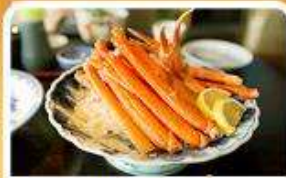
พิเศษ! ชาบู