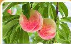
กิจกรรมเก็บผลไม้