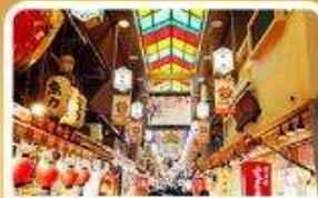
ตลาดปลาชิชิ