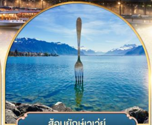
ล้อมยักเข่าเว่ย