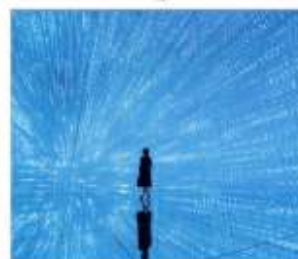
ทีมแล็บแพคนเน็ต