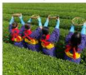
กิจกรรมเก็บชาみやโนเซ็น