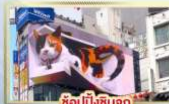
ซูปป์ิงชินจูกุ