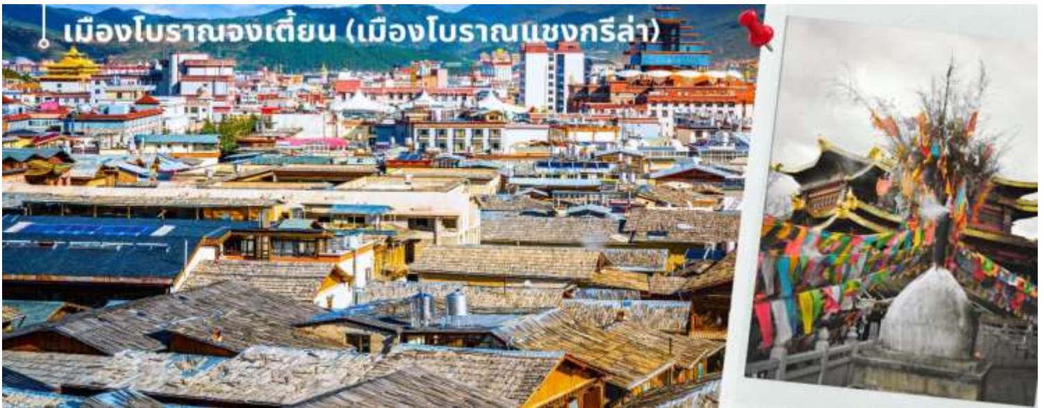
เมืองโบราณจงเตี้ยน (เมืองโบราณเซงกรี่ล่า)

นำท่านชม เมืองโบราณจงเตี้ยน (เมืองโบราณเซงกรี่ล่า) ตั้งอยู่ในเขตปกครองตนเองชนชาติทิเบต ตีซิง ทางตะวันตกเฉียงเหนือของมณฑลยูนนาน ที่ราบสูงทางภาคตะวันตกเฉียงใต้ของประเทศจีน มีชนชาติส่วนน้อย 25 ชนชาติอาศัยกันอยู่ อาทิ ชนชาติทิเบต ลีซอ น่าซี ไป และอี เป็นต้น ศูนย์รวมของวัฒนธรรมชาวทิเบต ลักษณะคล้ายชุมชนเมืองโบราณทิเบต ซึ่งเต็มไปด้วยร้านค้าของคนพื้นเมือง ร้านขายสินค้าที่ระลึกมากมาย