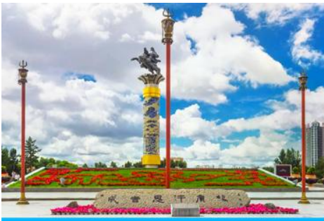
จัตุรัสวงกิสข่าน

หลังอาหารนำท่านเดินทางสู่เมือง ไห่ลาเอ๋อ 海拉尔市 (ระยะทาง 456 กม. ใช้เวลาเดินทางราว 5 ชั่วโมงครึ่ง)