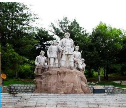
อนุสาวรีย์พิงหวง