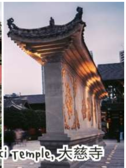
Daci Temple, 大慈寺