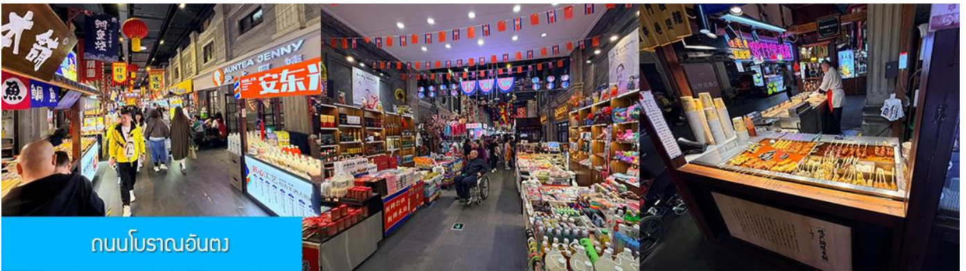
ถนนโบราณอันตง

จากนั้นนำท่านเที่ยวชม ถนนโบราณอันตง 安东老街 ถนนโบราณนี้เริ่มมีชื่อเสียงในฐานะเป็นย่านการค้าที่คึกคักที่สุดในใจกลางเมืองอันตง (ภายหลังได้เปลี่ยนชื่อเป็นต้นตง) ในปีค.ศ. 1876 ในสมัยราชวงศ์ชิง ปัจจุบันถนนสายนี้ยังคงไว้ซึ่งอาคารบ้านเรือนยุคเก่า(ราชวงศ์ชิง) และอบอวลด้วยวัฒนธรรมพื้นเมืองโบราณ ท่านจะได้สัมผัสการละเล่นและการแสดงพื้นเมือง ร้านค้าจำหน่ายของที่ระลึก ร้านอาหารท้องถิ่น และสตรีทฟู้ด ฯลฯ