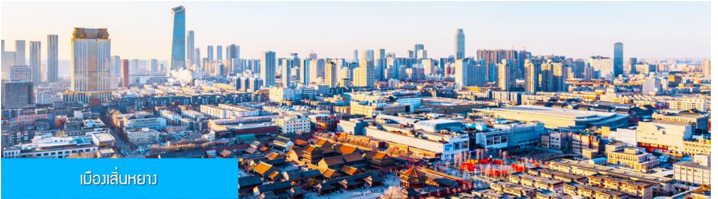
เมืองเสิ่นหยาง