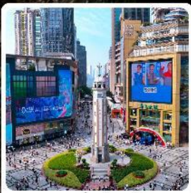
ถนนเจียฟางเป็ย