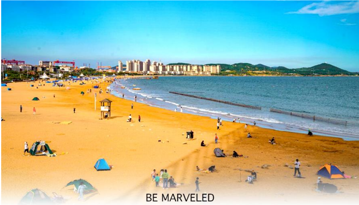
BE MARVELED หาดจินซาตาน

และชม หาดจินซาตาน ตั้งอยู่ในเขตหวงเต่า ของเมืองชิงเต่า มณฑลซานตง เป็นชายหาดที่ใหญ่ที่สุดและสวยที่สุดแห่งหนึ่งในเมืองชิงเต่า มีชื่อเสียงจากเม็ดทรายที่ละเอียดและมีสีเหลืองทองระยิบระยับ น้ำทะเลใสสะอาดและมีกิจกรรมหลากหลาย เช่น ว่ายน้ำ วอลเลย์บอลชายหาด และเครื่องเล่นทางน้ำ มีการจัดเทศกาลวัฒนธรรมและการท่องเที่ยวหาดทรายทองเป็นประจำทุกปีในช่วงฤดูร้อน