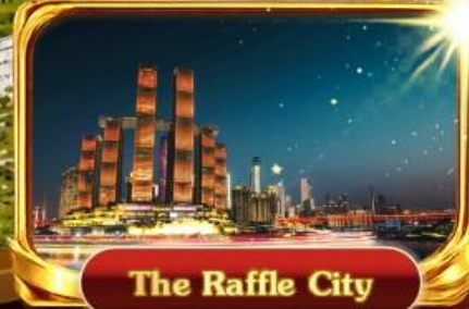
The Raffle City