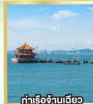
ท่าเรือจันเจียว