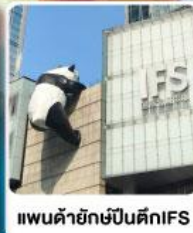
แพนด้ายักษ์ปีนตึกIFS