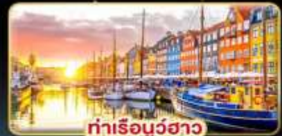
ท่าเรือบูธาว