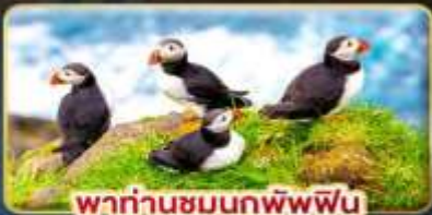
พาท่านชมนกพิภพ