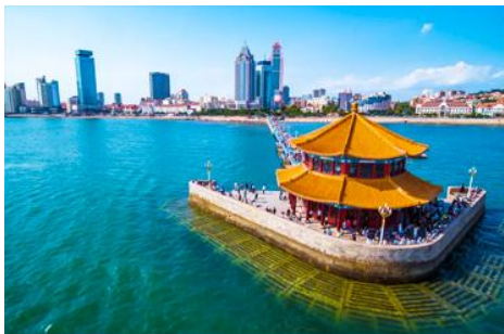
สะพานเทียนเจียว

เช้า รับประทานอาหารเช้า ณ ห้องอาหารของโรงแรม (1)