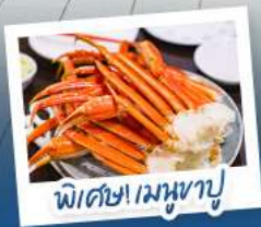
พิเศษ! เมฆหุบ