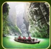
ล่องเรือแม่น้ำไตคินกุฮิว