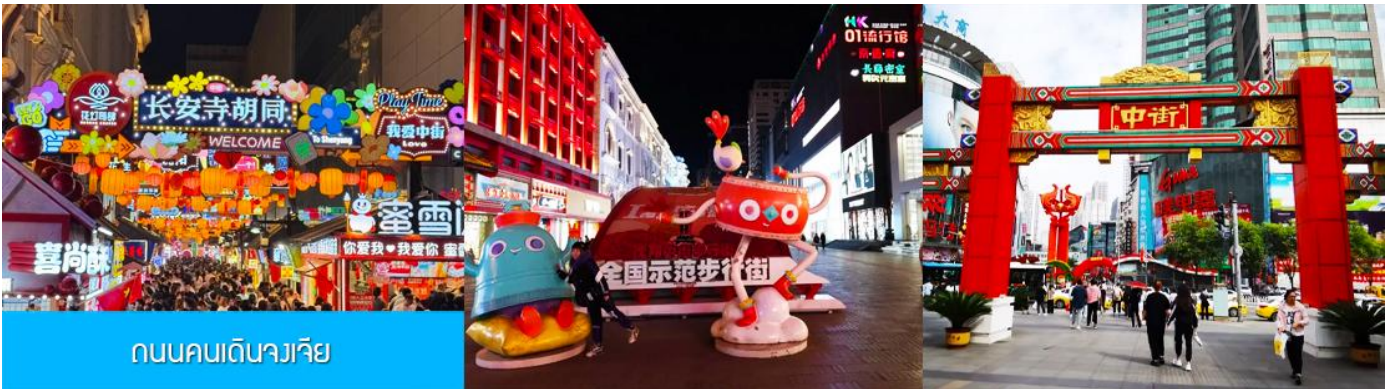
ถนนคนเดินจางเจีย

จากนั้นนำท่านเดินทางสู่ เมืองเสิ่นหยาง 沈阳市