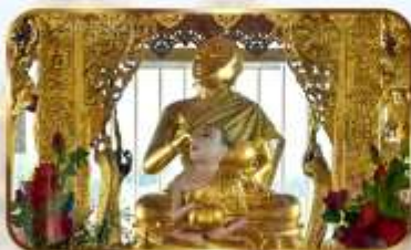
ขอพระพระอุปัศ ปางจกบาตรเยี่ยมาร