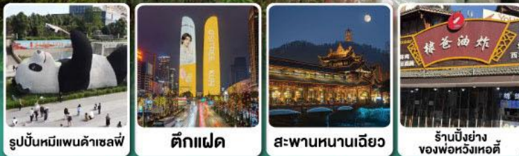
รูปปั้นหมีแพนด้าซาหลี่ ตึกแฝด สะพานหนานเจียว ร้านปิ้งย่างของพ่อหวังเหอตี้