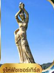
จูไห่ฟิชเชอร์เก็ส