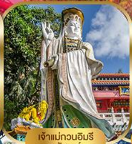
เจ้าแม่กวนอิม พลัสสมัย