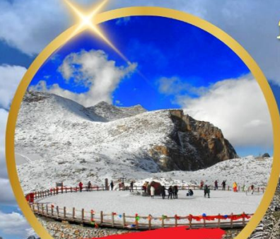
OPTIONAL TOUR ธารน้ำแข็งต่ากู่ปิงชวน