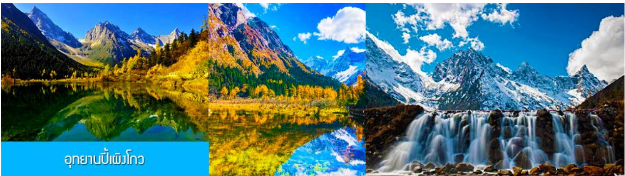
อุทยานปีศาจโกว