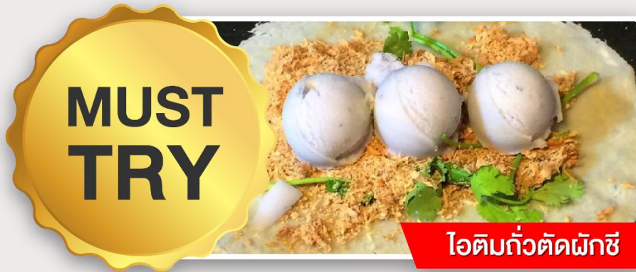
ไอติมแก้วตัดผักชี

นำท่านเดินทางกลับสู่ กรุงไทเป (TAIPEI CITY) ให้ท่านพักผ่อนและชมวิวทิวทัศน์สองข้างทางบนรถ (ใช้เวลาเดินทางประมาณ 1 ชั่วโมง)