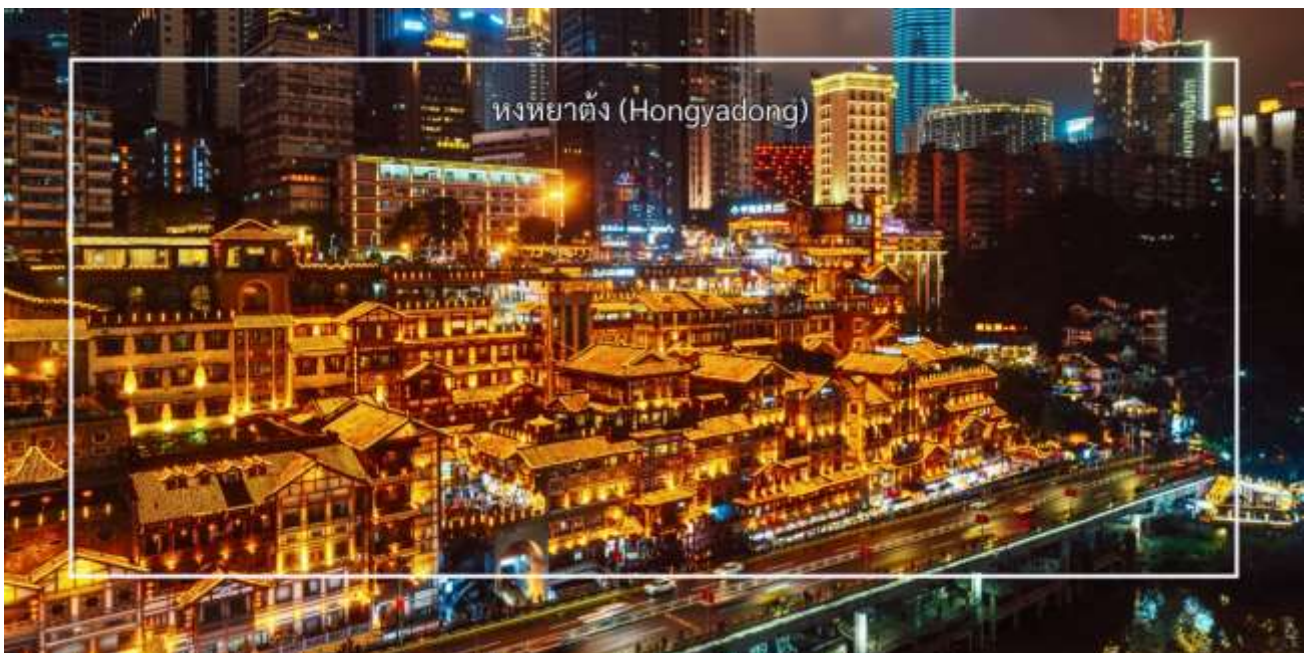
หงหยาดัง (Hongyadong)

นำท่านสู่ หงหยาดัง (Hongyadong) หรือที่เรียกว่า "Hongya Cave" เป็นสถานที่ท่องเที่ยวที่มีชื่อเสียงในเมืองฉงชิ่ง โดยตั้งอยู่ริมแม่น้ำแยงซี มีบรรยากาศที่เต็มไปด้วยวัฒนธรรมและประวัติศาสตร์ ตลาดหงหยาดังเป็นพื้นที่ที่มีอาคารแบบดั้งเดิมที่สร้างขึ้นในสไตล์สถาปัตยกรรมแบบซิโน-ทิเบต โดยมีร้านค้า ร้านอาหาร และบาร์จำนวนมาก ที่นี่คุณสามารถลิ้มลองอาหารท้องถิ่นที่อร่อย เช่น และขนมพื้นเมืองอื่นๆ นอกจากนี้ ตลาดหงหยาดังยังมีวิวทิวทัศน์ที่สวยงาม โดยเฉพาะในช่วงเย็นเมื่อไฟประดับส่องสว่าง ที่ทำให้บรรยากาศมีความโรแมนติกและน่าตื่นตาตื่นใจ คุณสามารถเดินเล่นตามทางเดินที่มีการจัดแสดงงานศิลปะและสินค้าท้องถิ่น