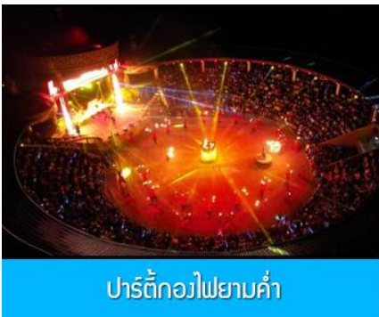
ปาร์ตี้กองไฟยามค่ำ