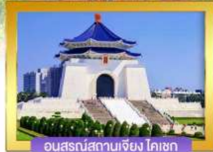
อนุสรณ์สถานเจียง ไคเชก