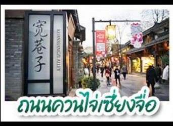
ถนนควนโจ้วเซียงจื่อ