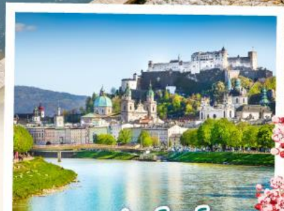
ซาคส์บวร์ค