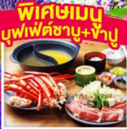
พิเศษเมนู บุฟเฟ่ต์ชาบู+ข้าว