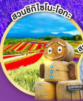
สวนซิกิโซโนะโอะกะ