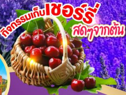
กิจกรรมเก็บเชอร์รี่ สดๆจากต้น