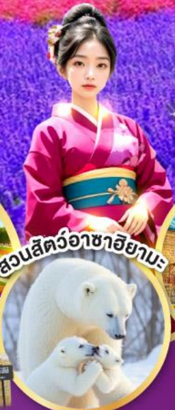
สวนสัตว์อาซาฮิยามะ