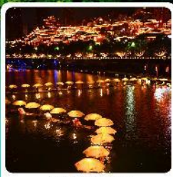
เมืองเซียนเอน

• โอลิมปิก อุทยานเทียนเหมินซาน หุบเขาอวตาร เมืองโบราณเซียนเอน หมู่บ้านโบราณฟูหลงเจิน ภูเขาโรมาอู่จียโต อุทยานซื่อจื่อกวนด่านสิงโต