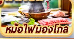
หม้อไฟมองโกล