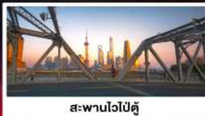
สะพานไวปู้ตู่