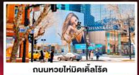
ถนนหวยโหมิดคัสโรด