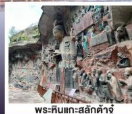
พระหินแกะสลักตำजू