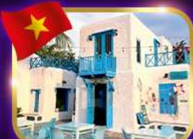
คาเฟ่สุดชิค ซานทรา มารีน่า