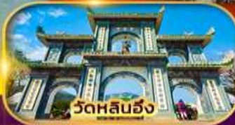
วัดหลันฮั่ง