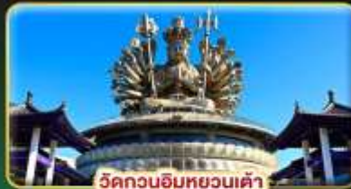
วัดกวนอิมหยวนเต้า