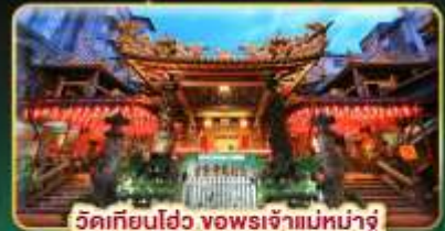
วัดเทียนโฮ่ว ขงพรเจ้าแม่หน่าจู้