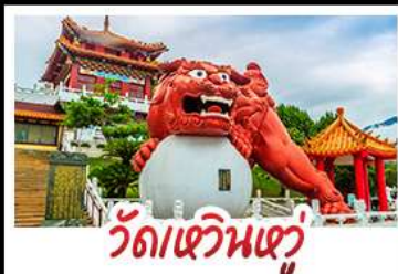
วัดเขวินเซวี่

อาลีซาน - ทะเลสาบสุริยอินจันตรา - ไทเป101 วัดหวินหู้ - อนุสรณ์สถานเจียง ไคเชก วัดหลงชาน - ตลาดกลางคืนซีเหมินติง เมนู หม้อหนึ่งจักรพรรดิ - เขียวหลงเปา - ชาบูไต้หวัน