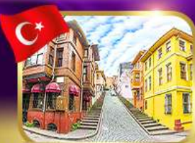
ชมบ้านหลากสีย่านบาลีก