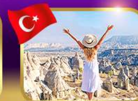
ชมความงาม หุบเขาแห่งรัก