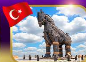
ม้าไม้เมืองทรอย ซานิคคาล