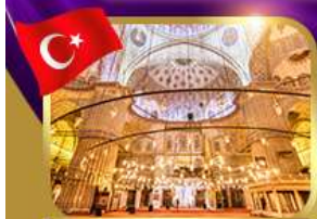
เข้าชมความงามสุเหร่าสีน้ำเงิน