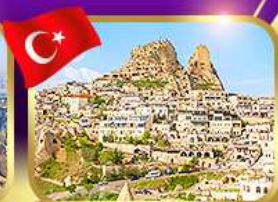
หุบเขาอุชิซาร์ คัปปาโดเกีย