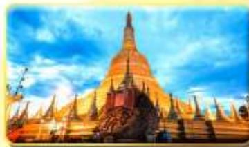
เจดีย์ชเวอดอร์