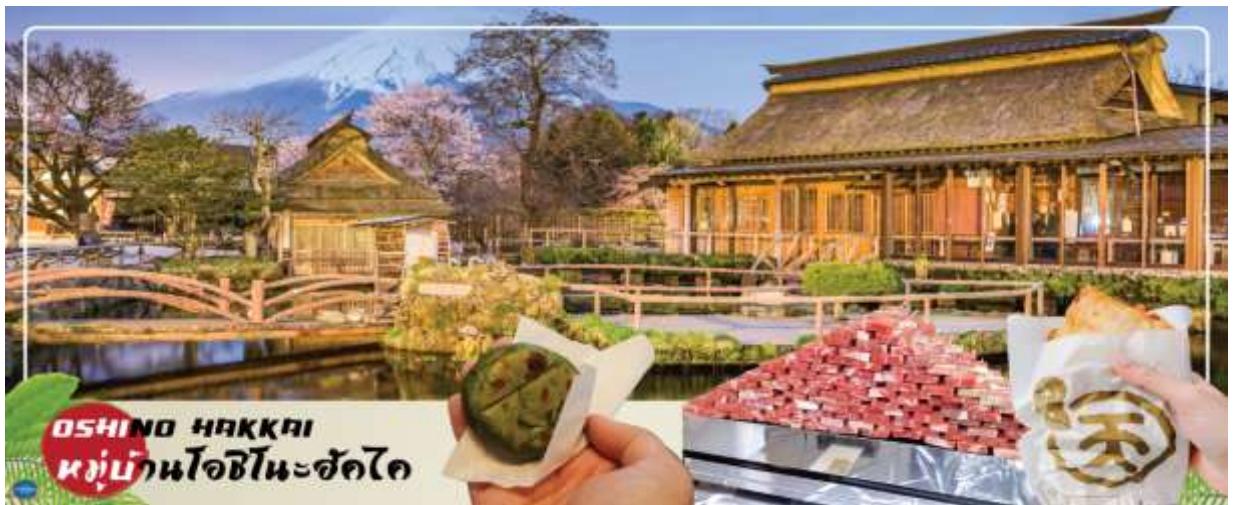
OSHINO HAKKAI หมู่บ้านโอชิโนะฮัคไค

หรือ เทศกาลชมดอกลาเวนเดอร์ที่ทะเลสาบคาวากุจิ Fuji Kawaguchiko Herb Festival (ซึ่งมีที่ผ่านมาเทศกาลอยู่ในช่วงวันที่ 21 มิถุนายน – 21 กรกฎาคม 2025) จัดขึ้นที่ริมทะเลสาบคาวากุจิในช่วงต้นฤดูร้อน ซึ่งนอกจากจะจัดขึ้นเพื่อต้อนรับฤดูชมดอกลาเวนเดอร์แล้ว ยังจะได้เพลิดเพลินไปกับความงามของดอกไม้หลากชนิด เช่น ดอกคาโมมายล์และสมุนไพรมากมาย โดยสถานที่จัดงานหลักคือ สวนสาธารณะยากิซาคิ (Yagizaki Park) สวนยอดนิยมที่ดึงดูดนักท่องเที่ยวมากมายด้วยลาเวนเดอร์ชอฟคริมและชาสมุนไพร์ และสวนสาธารณะโออิชิ (Oishi Park) ที่มีภาพภูเขาฟูจิซึ่งเป็นฉากหลังของทะเลสาบคาวากุจิตัดกันกับภาพทุ่งดอกลาเวนเดอร์อย่างสวยงาม อิสระให้ท่านได้วิ่งเล่นท่ามกลางทุ่งดอกลาเวนเดอร์สีม่วงสดใส สัมผัสกลิ่นหอมสดชื่น และเพลิดเพลินกับทิวทัศน์อันงดงาม พร้อมเก็บภาพความประทับใจตามอัธยาศัย (ดอกลาเวนเดอร์จะบานหรือไม่นั้น ทั้งนี้ขึ้นอยู่กับสภาพอากาศ สงวนสิทธิ์หากช่วงวันเดินทางลาเวนเดอร์ไม่มาแล้ว ก็ยังสามารถปรับโปรแกรมได้โดยไม่ต้องแจ้งล่วงหน้า)