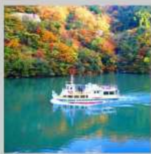
"SHOGAWA YURAN CRUISE"