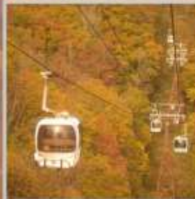
"HAKUBA IWATAKE GONDOLA"