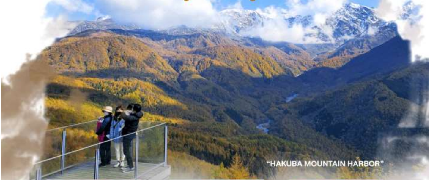
"HAKUBA MOUNTAIN HARBOR"