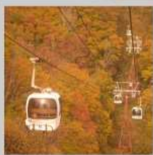
"HAKUBA IWATAKE GONDOLA"